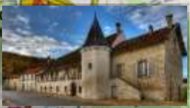
Départ du marché couvert