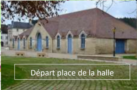
Départ place de la halle